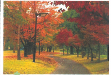
⑤ 御勅使南公園 (11月中旬～11月下旬)