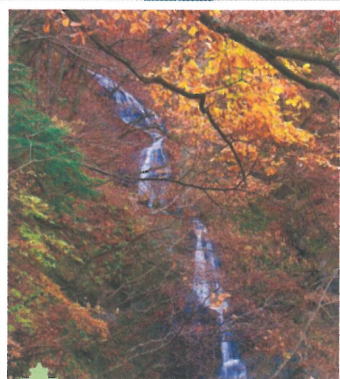
⑥ 芦安温泉郷(瀬戸千段の滝) (10月下旬～11月中旬)