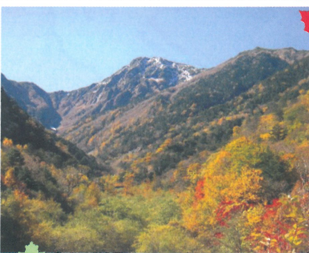
② 広河原(北岳を望む) (10月中旬～11月上旬)