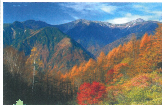
④ 夜叉神峠(白根三山を望む) (10月中旬～11月上旬)