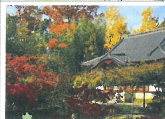
⑨ 古長禅寺 (11月中旬～11月下旬)