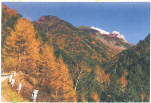
① 北沢峠(甲斐駒ヶ岳を望む) (10月上旬～10月中旬)