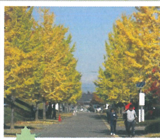
⑧ 榊形総合運動公園 (11月中旬～11月下旬)