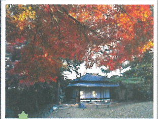
⑩ 安藤家住宅 (11月中旬～11月下旬)