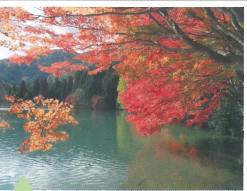
⑦ 南伊奈ヶ湖 (11月上旬～11月中旬)