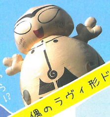
土偶のラヴィ形ドール