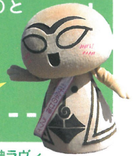
子宝の女神ラヴィ