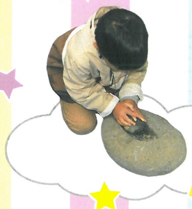
石器のつくりかたを体験しよう!