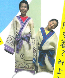
縄文服を着てみよう!